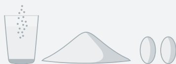
Granulat plus Kapseln